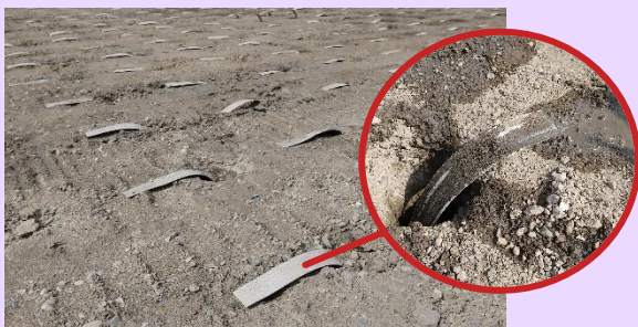
▲土中の水分を排出しています

■地盤改良（プラスチックボードドレーン工）は、粘性土層の圧密促進を図り、事前に軟弱地盤の沈下を促進させ、造成工事完了後における有害な残留沈下や不同沈下を低減させることを目的とします。