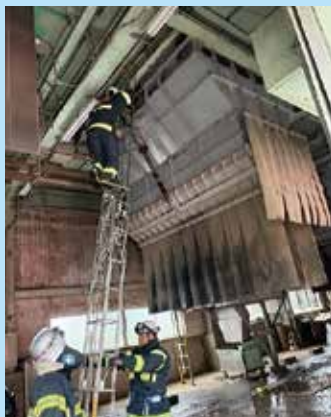
▲消防隊による作業の様子