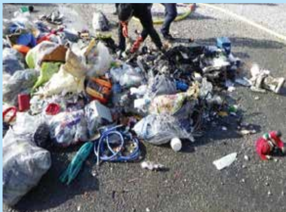
▲初期消火後に火原因となったリチウムイオン電池を取り除いている様子