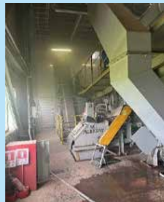
▲施設内に煙が充満する様子

センター管内(長浜市・米原市)ではここ数年、 不燃ごみ に 充電式電池 や スプレー缶 、 ライター の混入が原因とみられる発火・発煙事故が毎年発生しています。(令和4年度2件、令和5年度3件、令和6年度2件)このような事故は全国的にも多発しており、現在、ごみ処理の現場においては、分別の徹底が喫緊の課題となっています。